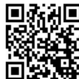
研修申込システム QR コード

≪URL≫ https://study.tokyo.med.or.jp/publish/